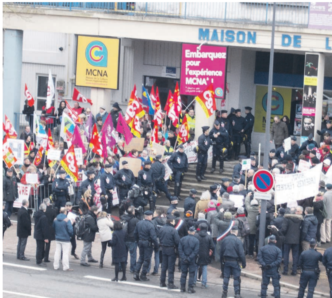
Les manifestants tenus à l'écart par les CRS.

Jeudi 1 er mars la ministre de la Santé est venue à Nevers aux états généraux de la Santé. Protégée par 50 CRS, elle a été accueillie par des manifestants en colère venus de tout le département.