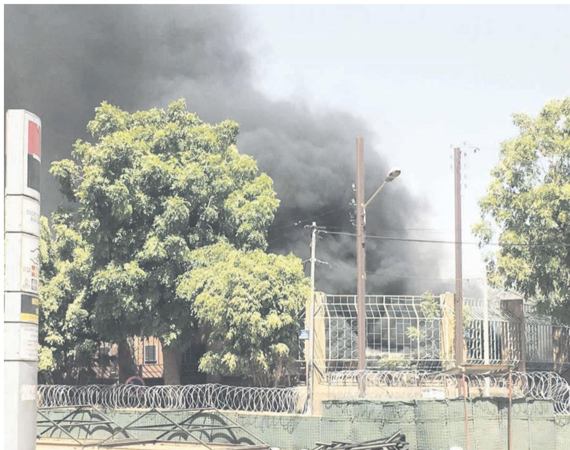
Explosion à l'intérieur de l'état-major burkinabé.