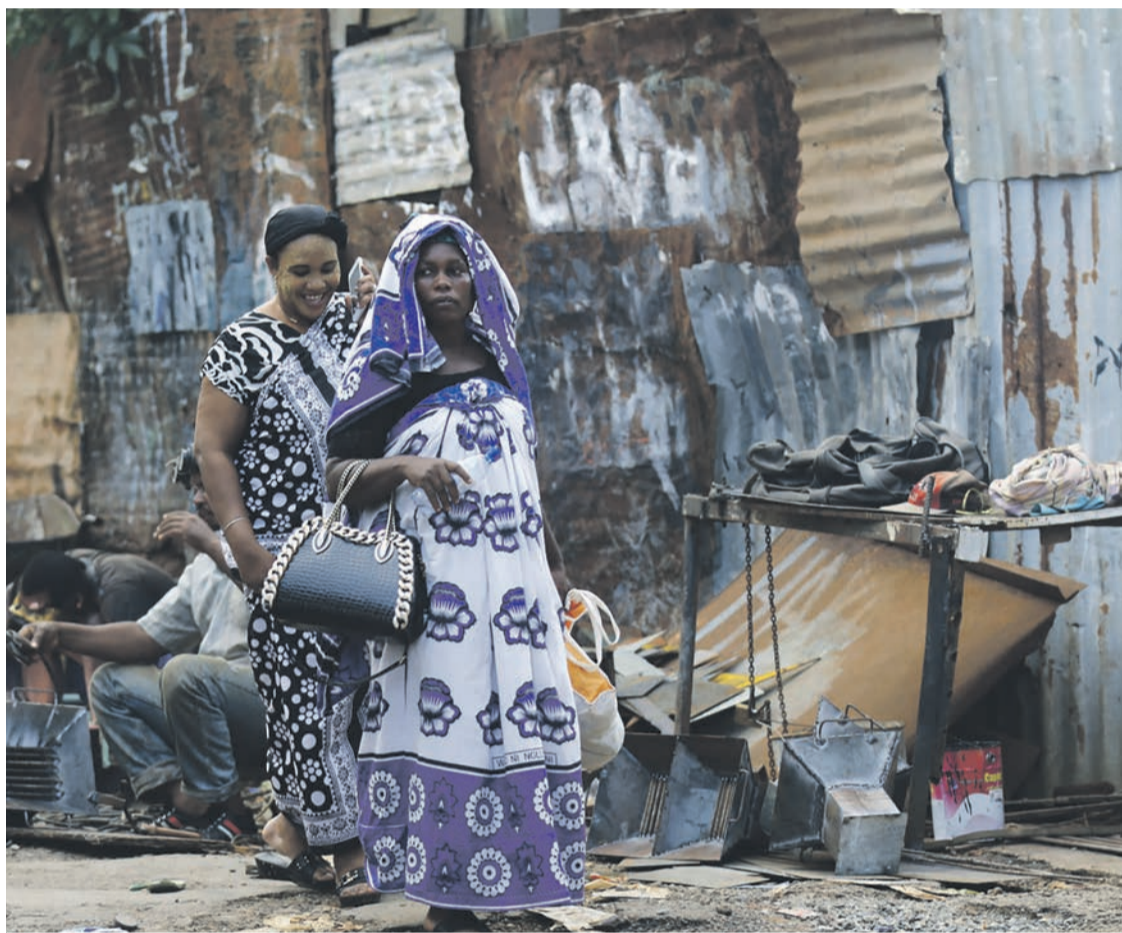
Dans un quartier pauvre de Mayotte.