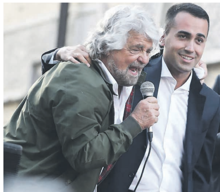
De Beppe Grillo à Luigi Di Maio... et à un parti de gouvernement.

Quant au parti xénophobe et raciste de Matteo Salvini, la Ligue, il a fait le plein des voix dans le nord du pays et a obtenu un peu moins de 18% des suffrages à l'échelle nationale, contre un peu plus de 4% aux dernières législatives