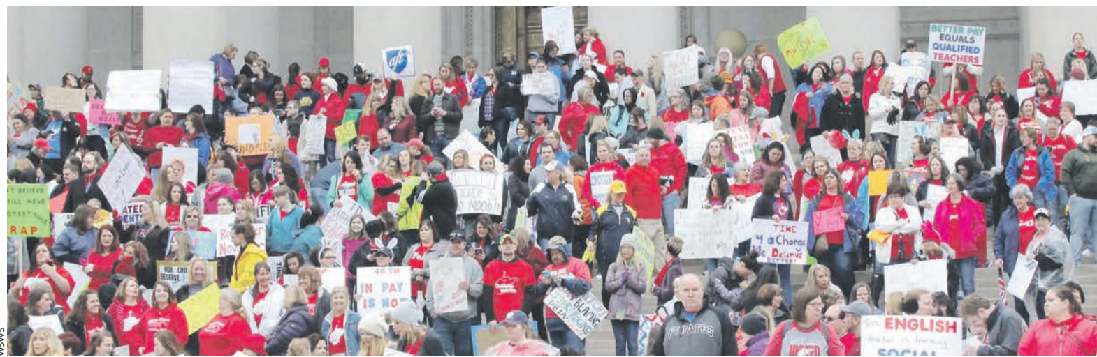
Rassemblement de travailleurs des écoles de Virginie-Occidentale.