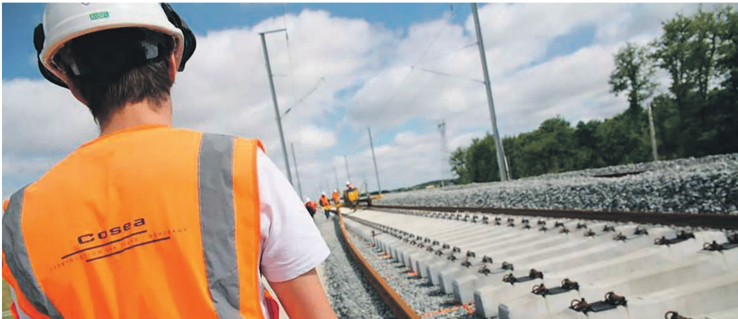
La LGV entre Tours et Bordeaux, construite dans le cadre d'un PPP avec Cosea, filiale de Bouygues et Vinci.

Ce qui est vraiment scandaleux, c'est que les 1% les plus riches de ce pays aient accaparé 82% des richesses créées en 2017 !