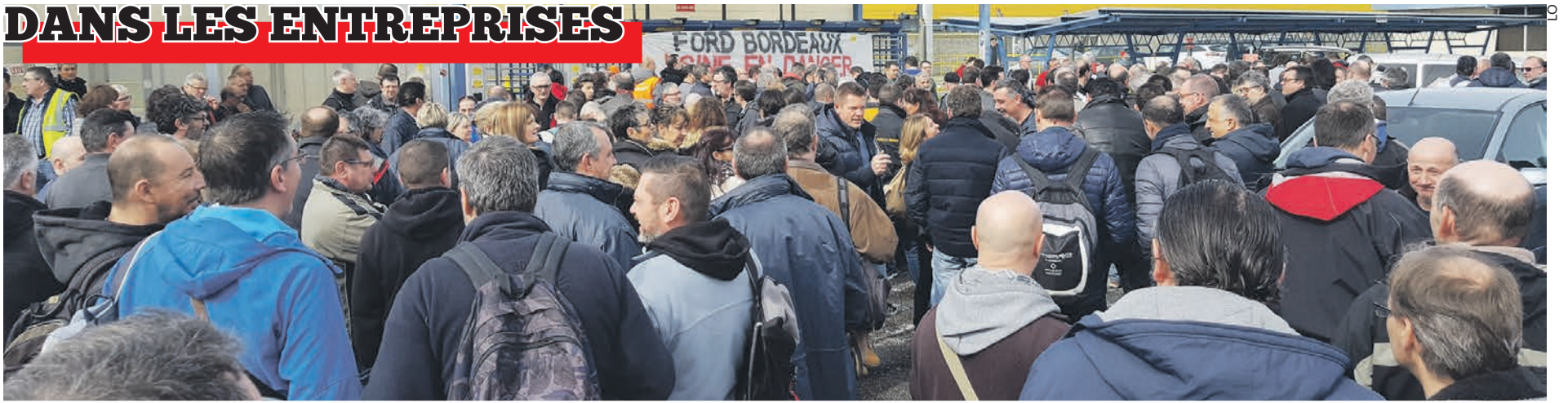
L'assemblée générale du 5 mars devant les portes de l'usine.