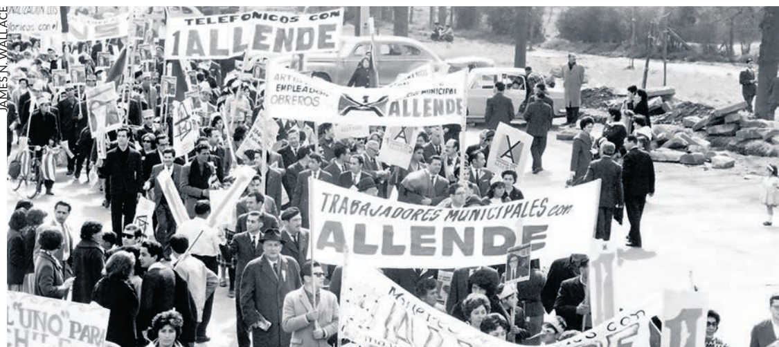
Manifestation de soutien à Allende lors de sa campagne de 1964.

Aux éditions Les Bons Caractères, par Christian Gasquet – 8,20 euros