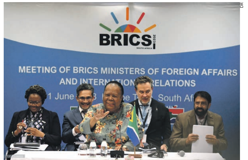
La ministre sud-africaine des Affaires étrangères au Sommet.

Aujourd'hui, l'Inde et la Chine sont en rivalité pour