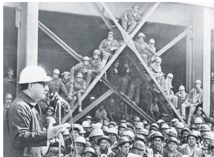
Allende devant les mineurs d'El Teniente.

Allende tenta de calmer l'élan que son élection avait encouragé. Mais cette montée de la combativité des classes populaires inquiétait la bourgeoisie chilienne. Loin de faire confiance au gouvernement pour y mettre un terme, elle commença à mener des campagnes pour déstabiliser le pouvoir.