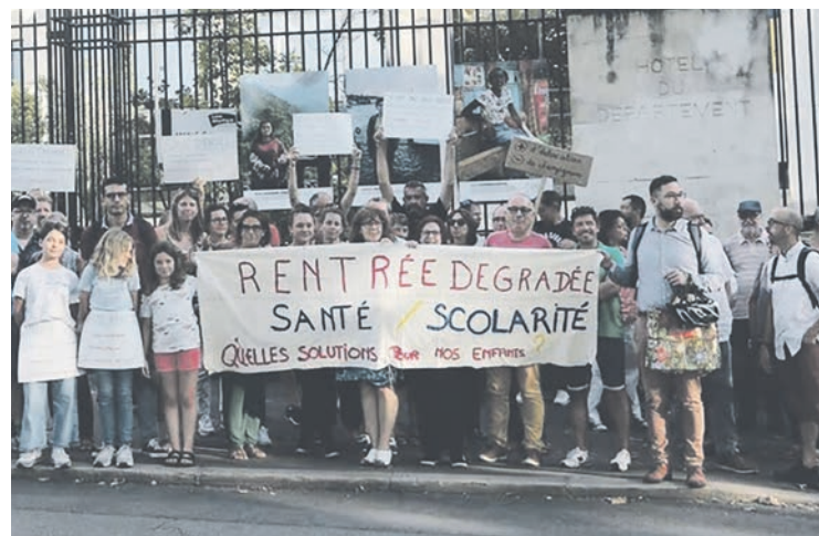
Manifestation devant un collège de la métropole nantaise.