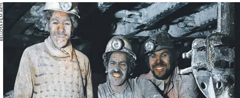
Immigrés marocains au fond d'une mine française.