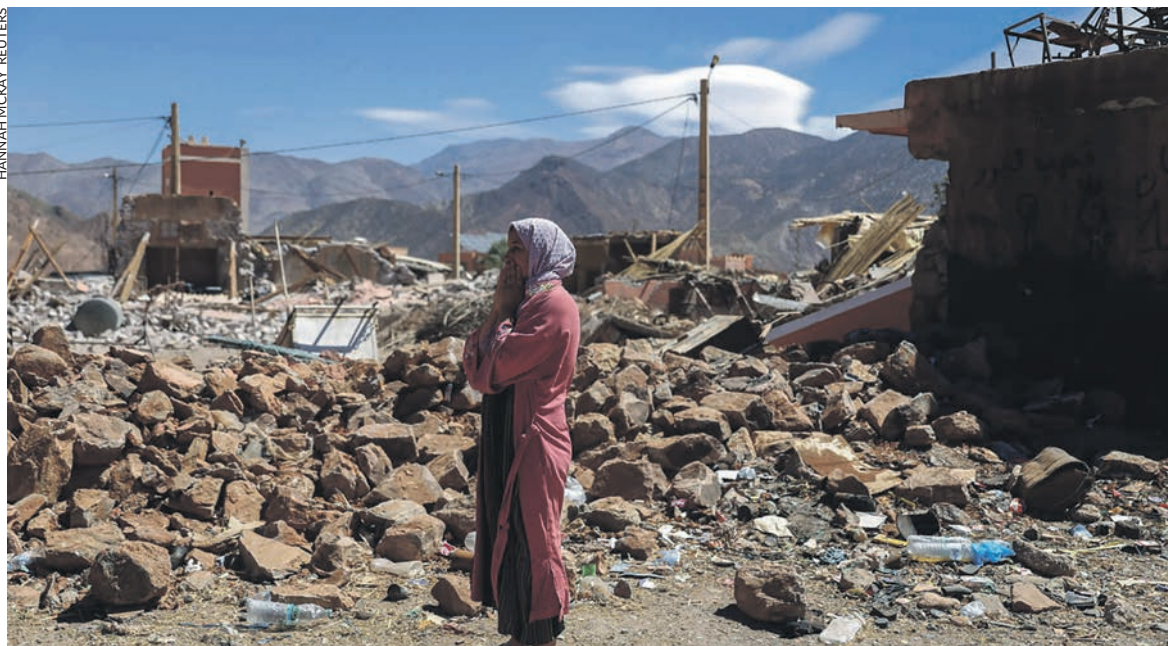
À Talat N'Yaaqoub, près de l'épicentre.

les habitations nécessaires, se contentant souvent d'ajouter un nouvel étage, porté par une dalle de béton, au-dessus de la maison ancienne, ce qui a contribué à la fragiliser.