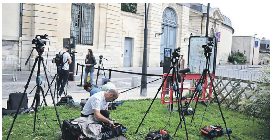
Pendant la réunion du 30 août à Saint-Denis.