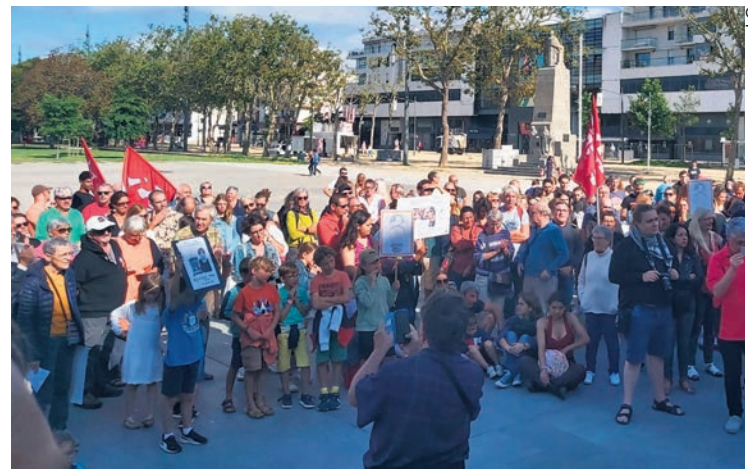
Rassemblement du 2 septembre à Lorient.