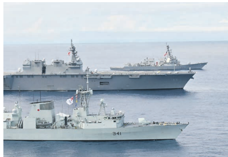
Navires canadien, japonais et américain en mer de Chine en septembre.

D'après le responsable du PCF Patrick Le Hyaric, la Fête de l'Humanité « va être un lieu unique de l'exigence populaire de la paix mondiale et du désarmement. » Mais si l'exigence populaire est bien la paix, à qui doit-elle s'adresser ? Ce discours revient à placer ses espoirs dans les gouvernements, l'ONU, Macron, Biden et la pression que les peuples pourraient pacifiquement exercer sur eux. C'est passer sur le fait que la guerre est, à un moment ou un autre, inévitable dans le système capitaliste, que c'est une conséquence inévitable, dans certaines conditions, de la course au profit