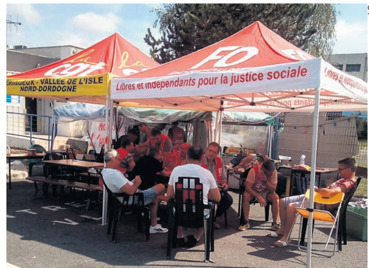
Le piquet devant l'usine.