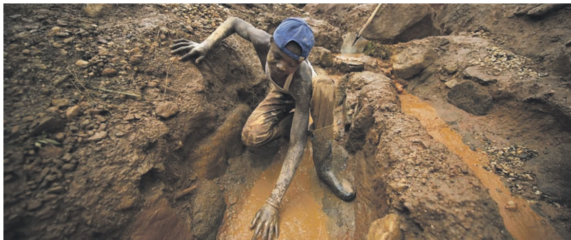
Mine de cobalt au Congo.

Afrique: face aux rivalités impérialistes, pour une politique de la classe ouvrière