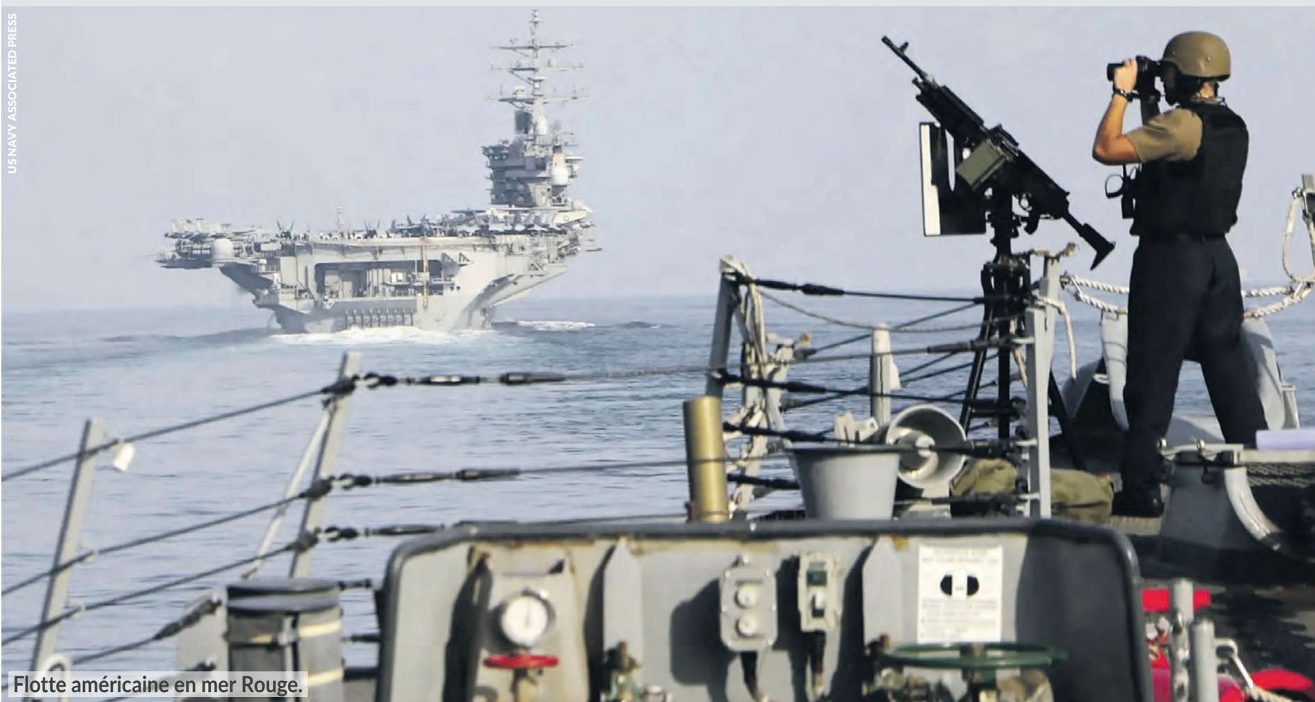
Flotte américaine en mer Rouge.

Fonctionnaires Face aux attaques, une seule classe ouvrière