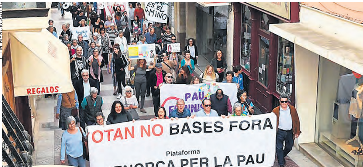
Manifestation le 7 avril à Maó, aux Baléares, contre la présence des troupes de l'OTAN.