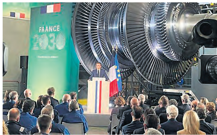
Macron chez General Electric Belfort.

Tous les tenants du patriotisme économique, de la souveraineté industrielle, des « intérêts de la nation »,