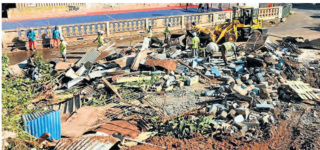
Bidonville détruit lors de l'opération Wuambushu 1, au printemps 2023.

Il n'empêche ! Aucun des responsables politiques de tous bords, qui en ce moment