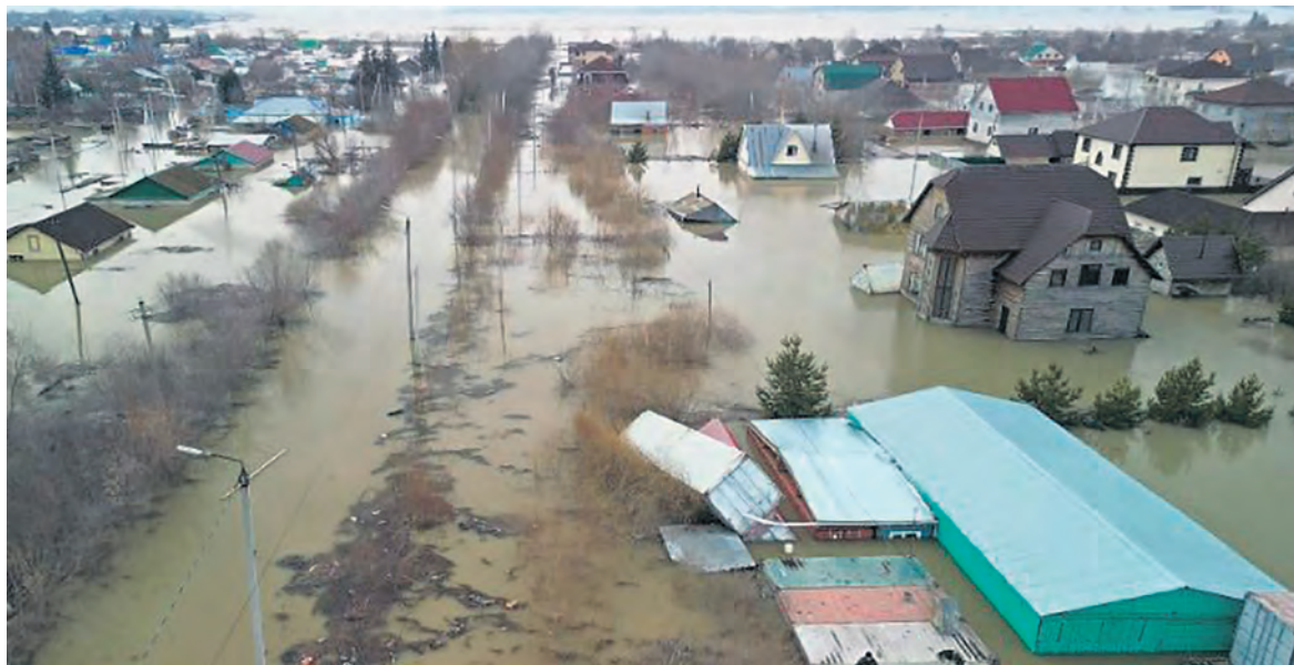
Un quartier inondé au nord du Kazakhstan.

Comme d'habitude en pareil cas, le pouvoir se tait et détourne le regard. Il préfère laisser les autorités locales se débrouiller seules, quitte, après coup, à y choisir quelques coupables pour