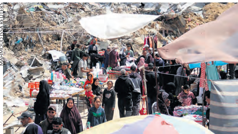
Un marché dans les décombres, dans le nord de la bande de Gaza.