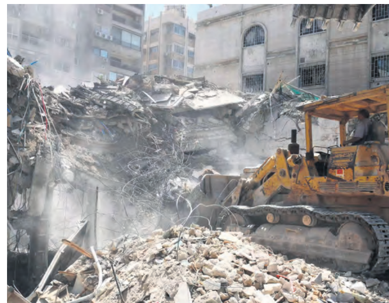
Le consulat d'Iran à Damas après le bombardement israélien.

L'attaque d'Israël par des drones et des missiles iraniens le 13 avril était donc nécessaire pour le régime iranien, en même temps qu'elle était très mesurée. Les dirigeants iraniens ont voulu montrer leur capacité à lancer près de 300 missiles et drones capables d'atteindre Israël. Et leur interception