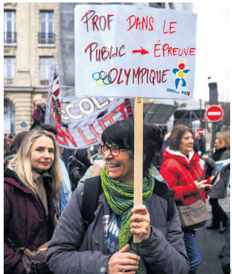
Manifestation de professeurs le 1 er février 2024.