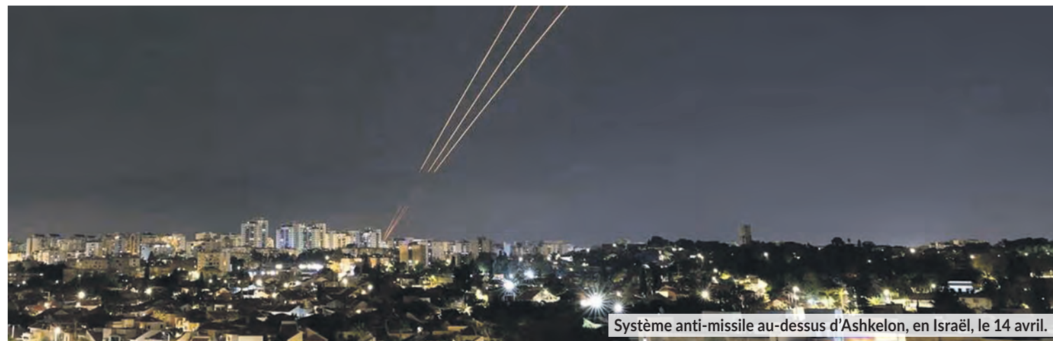
Systeme anti-missile au-dessus d'Ashkelon, en Israël, le 14 avril.