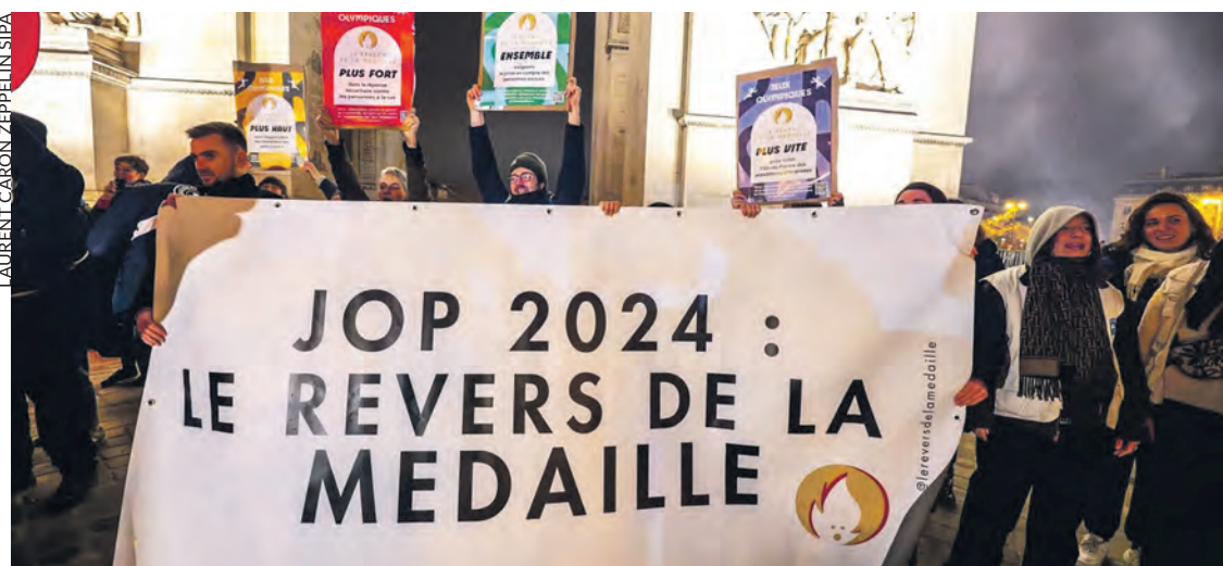
Incursion au pied de l'Arc de triomphe de Paris pour dénoncer la situation des sans-abri.