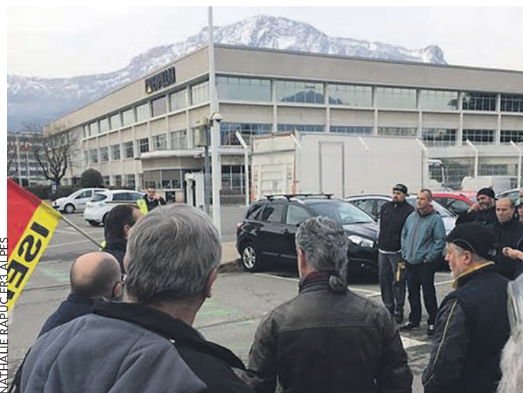
Lors d'une grève à Grenoble.