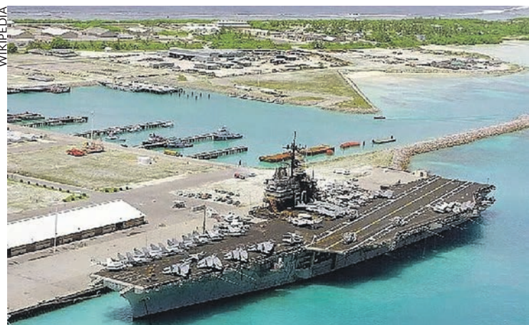
La base américaine de Diego Garcia.