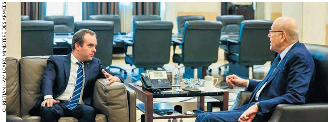
Le ministre de la Défense, Lecornu, en visite chez le Premier ministre libanais il y a un an.