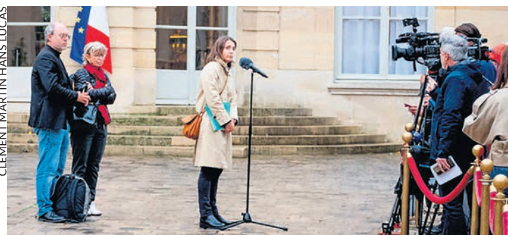
La délégation de la CGT reçue par Barnier, devant Matignon.

Alors que le gouvernement Barnier annonce des attaques massives contre les travailleurs, ce prétendu dialogue social est une mascarade. Contre le patronat, Barnier et Macron, ce n'est pas de « partenaires sociaux » dont les travailleurs ont besoin, mais de perspectives de luttes pour riposter à ces attaques avec leurs armes de classe.