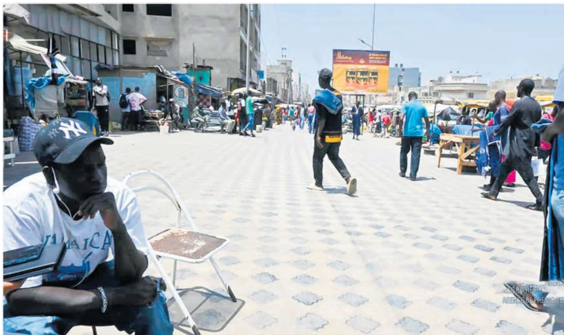
Centre commercial du marché Grand Yoff à Dakar.

Depuis six mois, Diomaye Faye et Ousmane Sonko sont tous deux au pouvoir, l'un président et l'autre Premier ministre, mais la lutte contre la vie chère qu'ils promettaient quand ils étaient opposants a été repoussée aux calendes grecques. Les caisses de l'État, disent-ils, ont été dilapidées par ceux