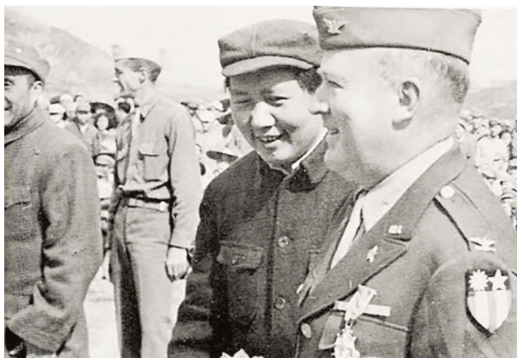
En 1944, rencontre entre Mao et un commandant US.

En 1937, le Kuomintang et le PC, qui dominait certaines provinces, cessèrent de s'affronter pour s'allier contre le Japon qui étendait alors son emprise sur toute la Chine. L'occupation par le Japon fut particulièrement violente, et sa défaite en 1945 fut l'occasion d'un véritable soulèvement paysan. L'objectif du PC fut alors de former un gouvernement