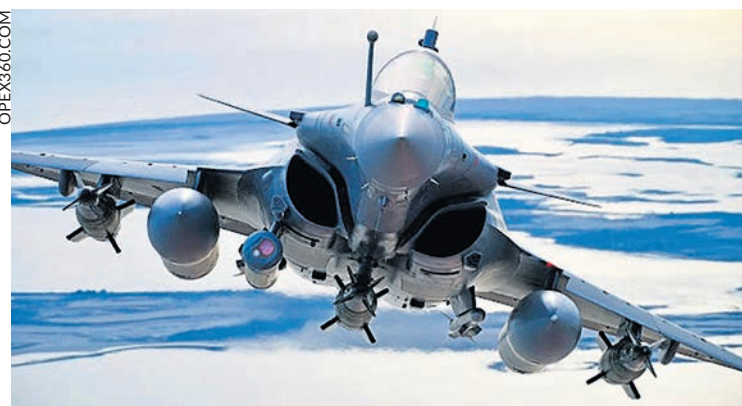
Un Rafale acheté par l'État français.