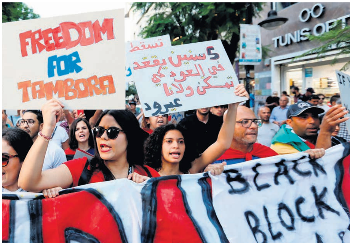
À Tunis, manifestation contre Kais Saïed le 4 octobre.

Au demeurant, des dizaines d'opposants, personnalités politiques, artistes, journalistes... sont en prison, certains depuis des mois, le pouvoir de Kais Saïed pourchassant toute critique, grâce à un article de loi punissant l'usage de « fausses informations ». C'est ainsi que récemment, l'hebdomadaire Réalités s'est vu menacé du crime de « désinformation » pour avoir publié, le 26 septembre, un article sur le risque de pénurie de céréales, sujet sensible