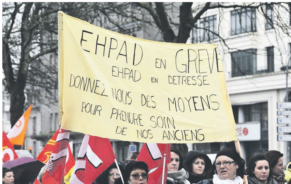
Manifestation d'employées en Ehpad.

La rentabilité de ces centres s'appuie sur le remboursement des soins par la Sécurité sociale. Mais les financiers ont aussi développé des montages financiers complexes qui leur permettent d'orienter l'activité des professionnels vers les