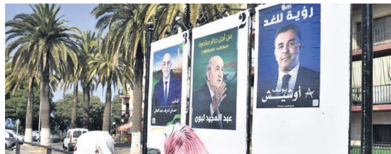
Alger, fin août 2024.