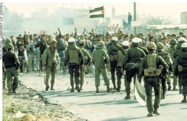
Lors de la première Intifada dans la bande de Gaza en 1987.