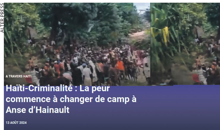
Haïti-Criminalité : La peur commence à changer de camp à Anse d'Hainault