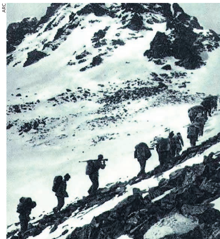
Soldats de l'armée de Mao dans le Sichuan en 1935.