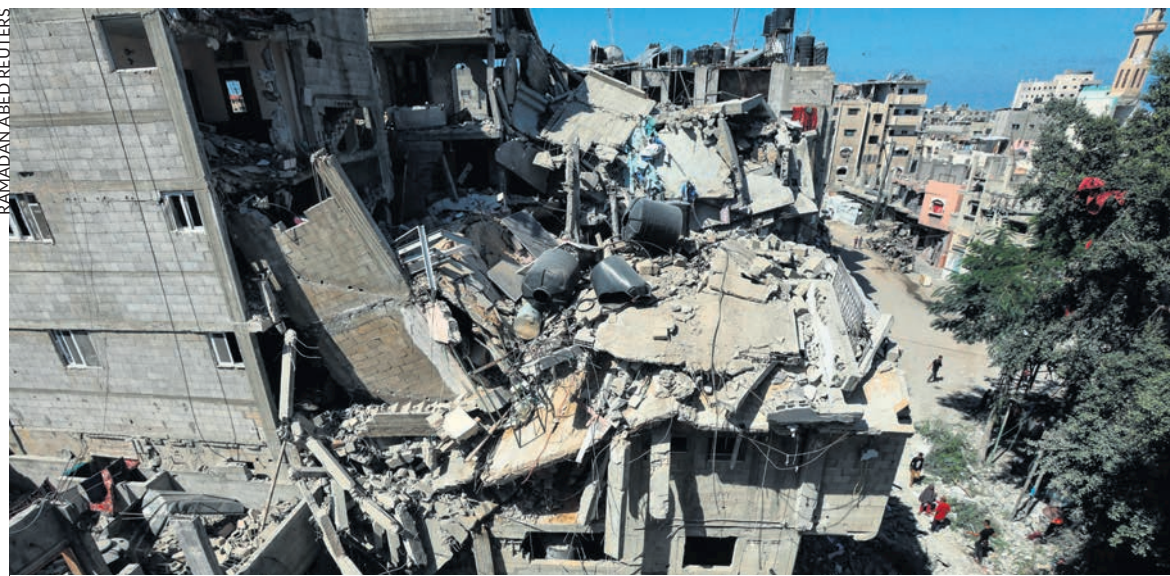
Le camp de réfugiés de Bureij, dans le centre de la bande de Gaza, le 8 octobre 2024.

Loin d'avoir été détruit, le Hamas semble même être parvenu, d'après de nombreux témoignages, à maintenir dans le nord de Gaza un