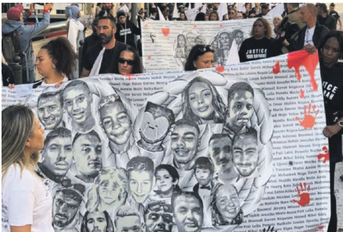
14 septembre, marche pour dénoncer les morts dus au trafic de drogue à Marseille.