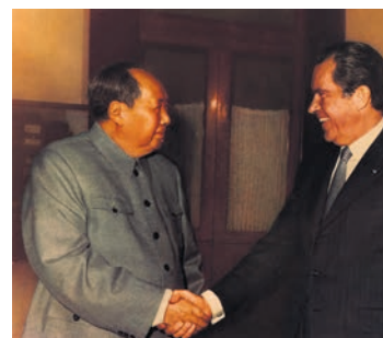
Nixon, président des États-Unis, en visite en Chine en 1972.

À la fin des années 1960, ce sont les États-Unis qui, embourbés au Vietnam, changèrent de politique, à la recherche d'un point d'appui dans la région. Cela aboutit au rétablissement des relations diplomatiques, illustré spectaculairement par la rencontre, en 1972, du