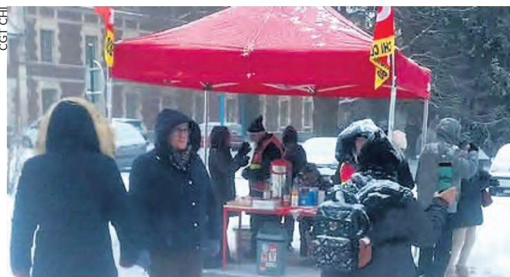
Rassemblement du 7 janvier au CHI de Clermont.

Le 24 avril, une militante syndicale de la CGT, retraitée de l'hôpital psychiatrique CHI, a été convoquée par la gendarmerie de Clermont-de-l'Oise en audition libre. Elle a été interrogée sur des plaintes déposées à son encontre suite à une action syndicale.