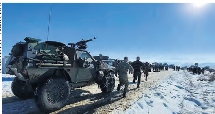
Soldats français à Cincu, en Roumanie.