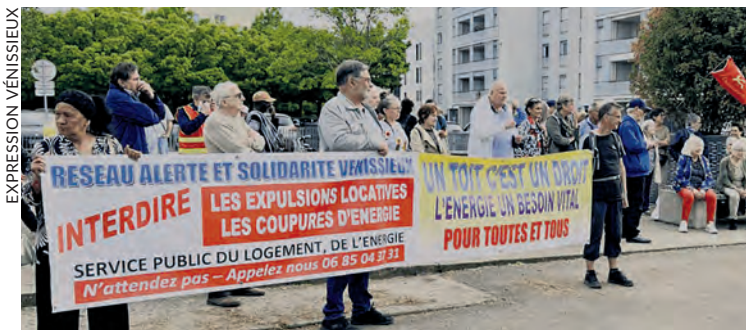
Rassemblement contre les expulsions du 30 avril.

Jeudi 30 avril, une petite centaine de personnes se sont rassemblées devant la médiathèque de Vénissieux pour protester contre les expulsions locatives.