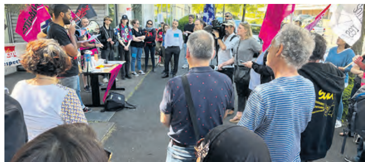
Rassemblement des inspecteurs du travail, le 27 avril.

(Direction départementale de l'emploi, du travail et de la solidarité) pour protester contre l'arbitraire de leur directeur. Celui-ci s'était permis d'intercepter leurs courriers adressés à plusieurs employeurs – tous à la tête d'entreprises de plus de 15 salariés – pour leur rappeler la loi et la possibilité de contrôles lors de ce jour férié. Il avait également expulsé brutalement de son