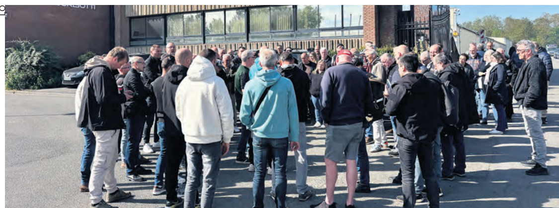
Rassemblement le 27 avril 2026.