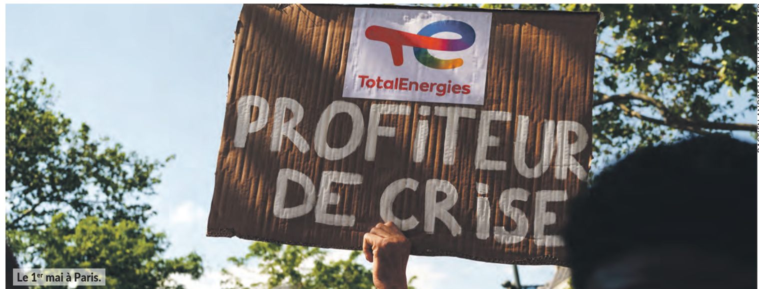
BASTIEN ANDRE HANS LUCAS VIA AFP