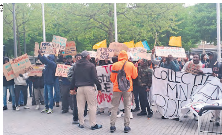
Manifestation à Lille, en 2025.

Selon les chiffres du ministère de la Justice, le Nord est un des départements où vivent le plus de mineurs isolés étrangers, souvent privés d'école.