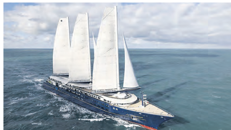
L'Orient Express Corinthian.

Cerise sur le caviar, 31 millions d'euros de subventions ont été versés sous différents prétextes pour cette construction, dont celui de « verdissement de la flotte de commerce » et de « décarbonation de l'industrie maritime ». La décarbonation est très relative, car 240 tonnes de gazole et 290 tonnes de GNL sont embarquées pour garantir, à l'escale ou en navigation, les déplacements de tout ce beau monde. Mais ce qui risque de verdir aussi est le teint des passagers lorsque le