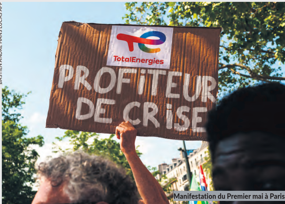
Manifestation du Premier mai à Paris.