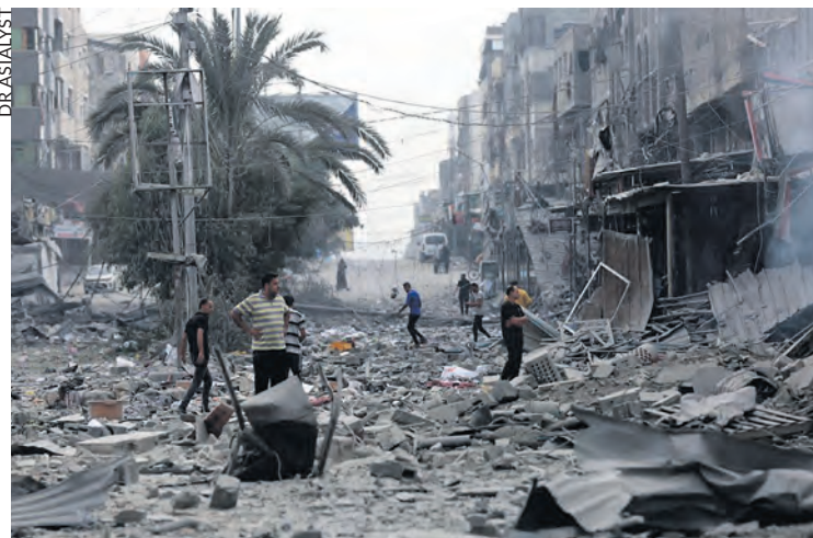
Destructions à Téhéran.

Après cinq semaines de bombardements israélo-américains ayant entraîné des milliers de morts et des destructions massives, suivies de trois semaines de trêve et alors que la marine américaine bloque ses ports, l'Iran a proposé à ses agresseurs un plan de paix en quatorze points.