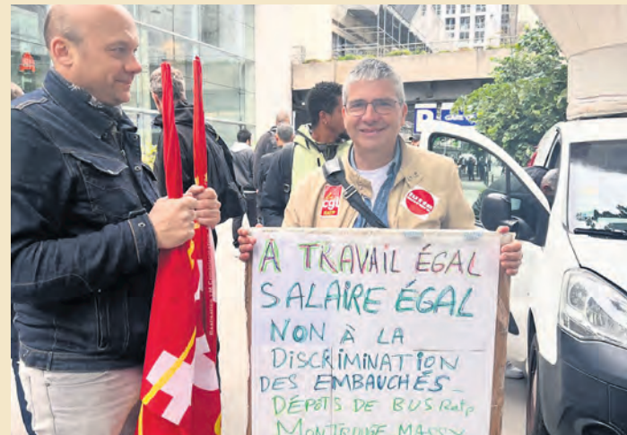
Lors du rassemblement du 27 mai 2024, au siège de la RATP.

Depuis le 1 er mai, une nouvelle étape a été franchie dans les attaques contre les travailleurs des bus de la RATP à Paris et en proche banlieue.