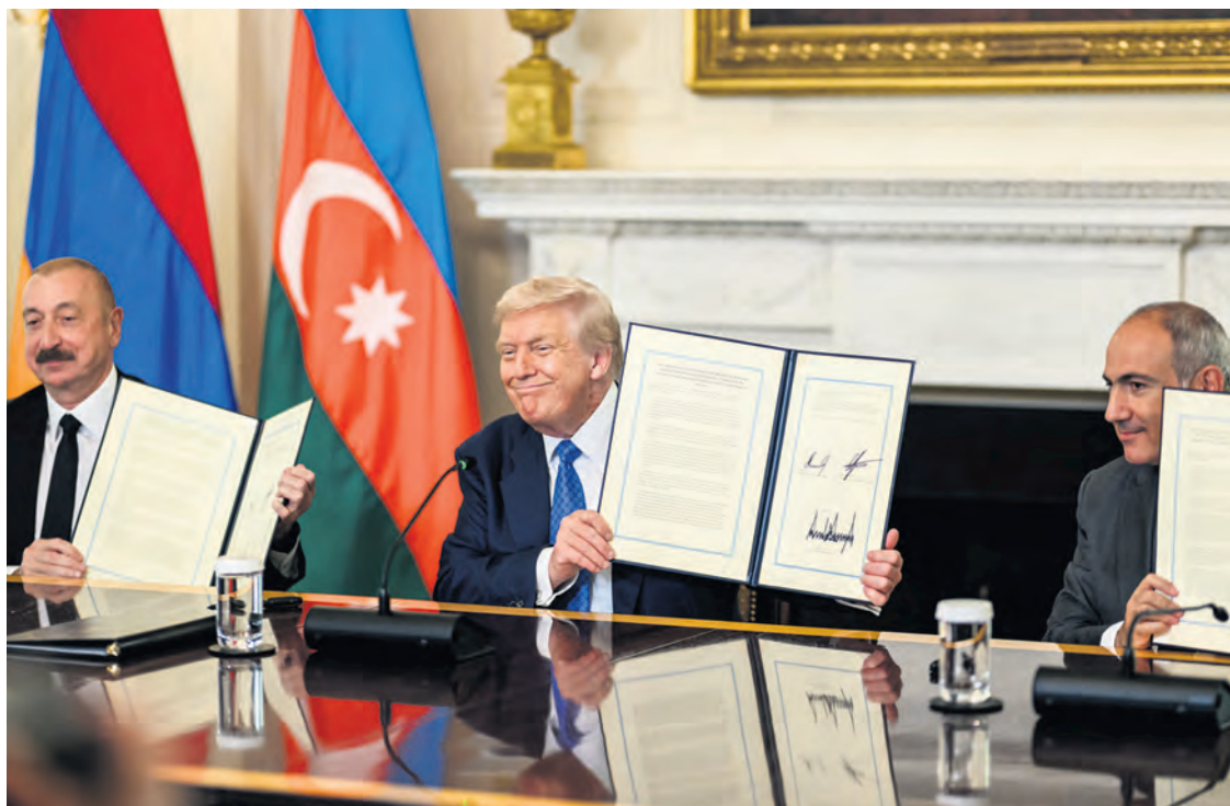
Trump exhibe l'accord de paix Arménie-Azerbaïdjan signé sous son égide en 2025.

L'UE mène donc son offensive diplomatique au moment où l'Arménie laisse entendre qu'elle pourrait vouloir la rejoindre. Et cela vient à point pour conforter le camp pro-européen dans le pays, car des élections législatives y auront lieu le 7 juin. Si le Premier ministre arménien avait reçu Poutine, au lieu d'accueillir Ursula von der Leyen et une brochette de dirigeants européens, on imagine quelles dénonciations de « tentative d'ingérence électorale du