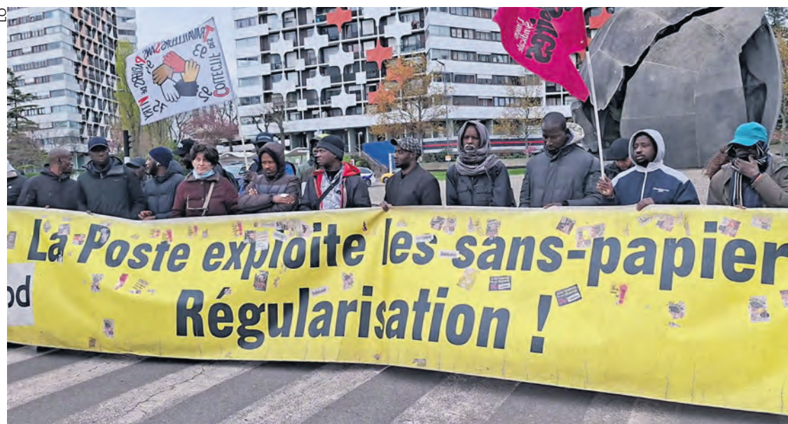
Les travailleurs sans papiers devant la préfecture de Créteil, le 27 mars.