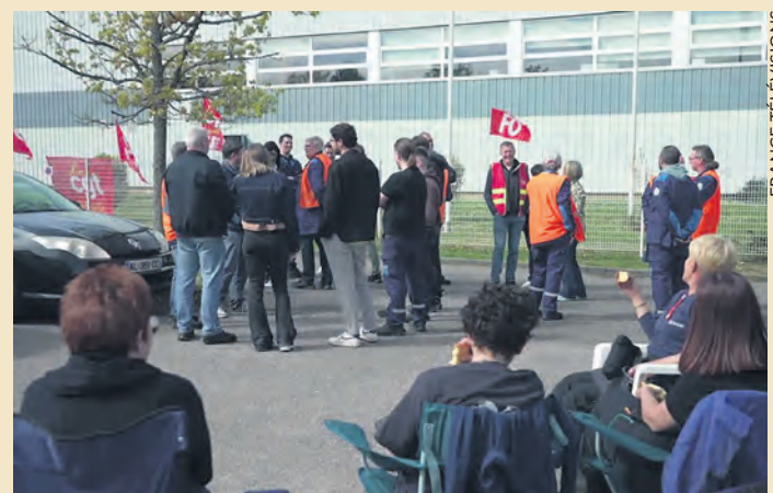
Débrayage le 16 avril.