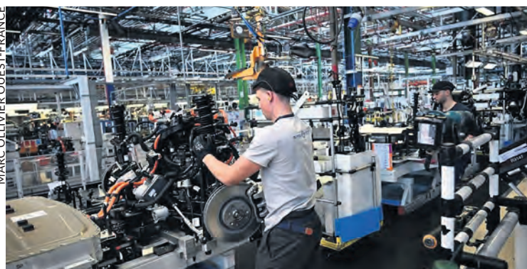
Fabrication du Citroën C5 Aircross à Rennes-La Janais.