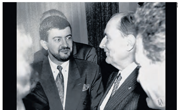
Mélenchon avec Mitterrand, dans les années 1980.

Depuis presque vingt ans, au fil des élections, Mélenchon alterne ainsi les