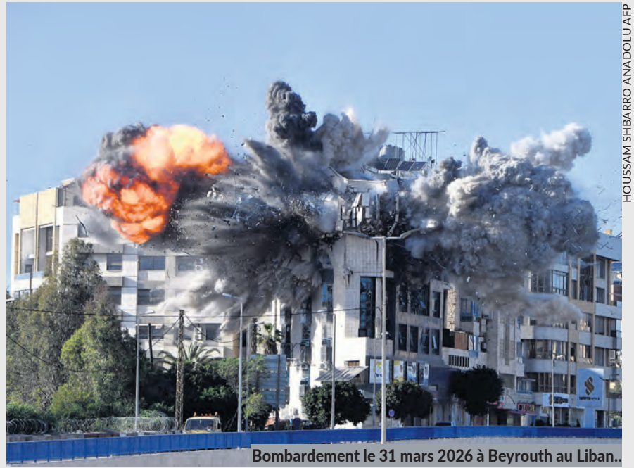
Bombardement le 31 mars 2026 à Beyrouth au Liban..